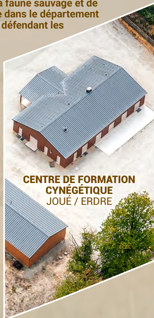
CENTRE DE FORMATION CYNÉGÉTIQUE JOUÉ / ERDRE