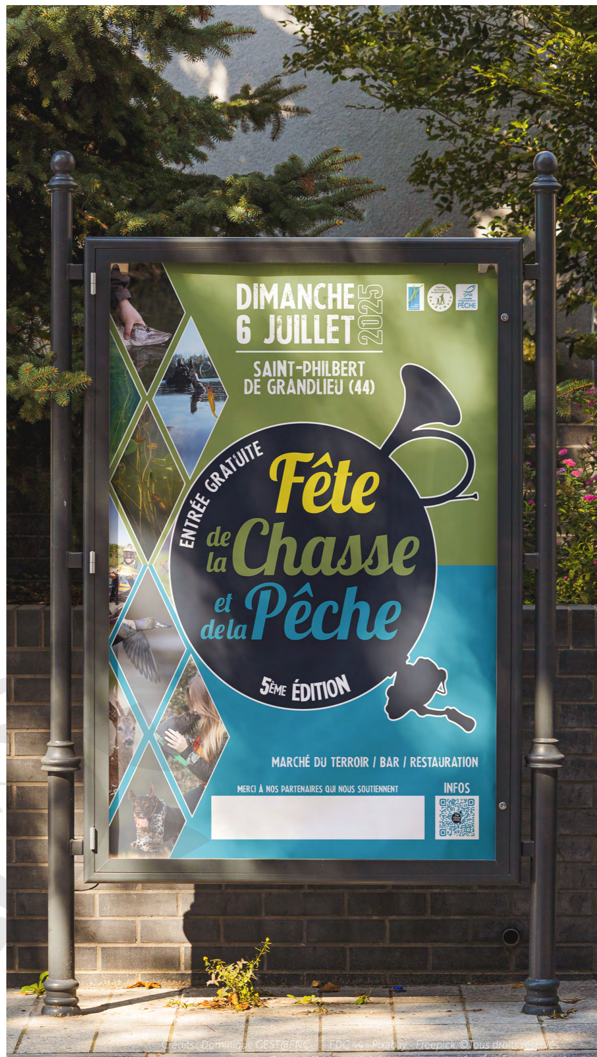
Credits - Dominique GEST @FNC - FDC 44 - Pixabay - Freepick. ©Tous droits réservés.

PARTAGER CES INFORMATIONS AVEC LES MEMBRES DE VOTRE ASSOCIATION.